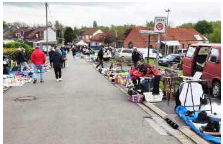
29 avril : Marché aux puces du Judo-Club.