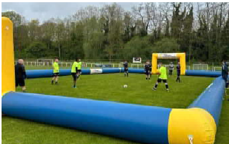
14 avril : Journée district Artois au stade municipal