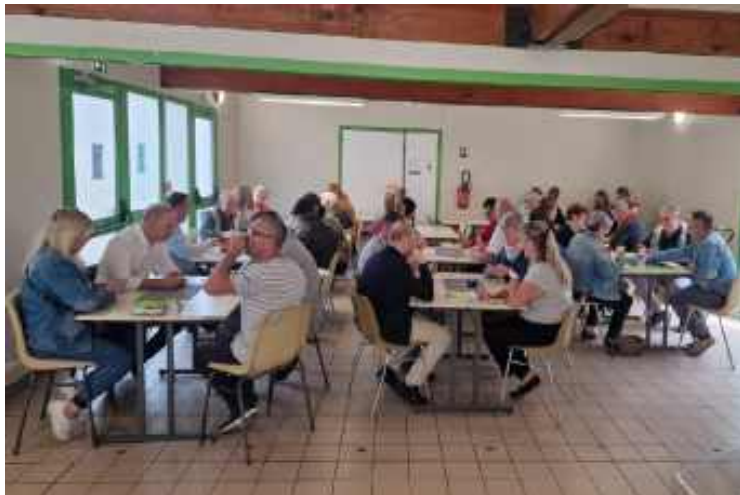
14 avril : Concours de belote organisé par «Éleu c'est vous»