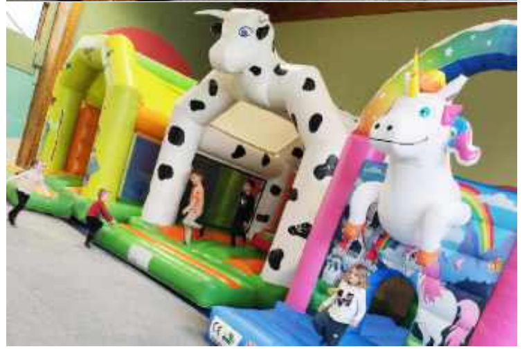
Du 22 au 28 avril : XXL Winter Kids