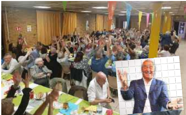
13 avril : Soirée «Ch'ti» organisée par le Comité des fêtes.