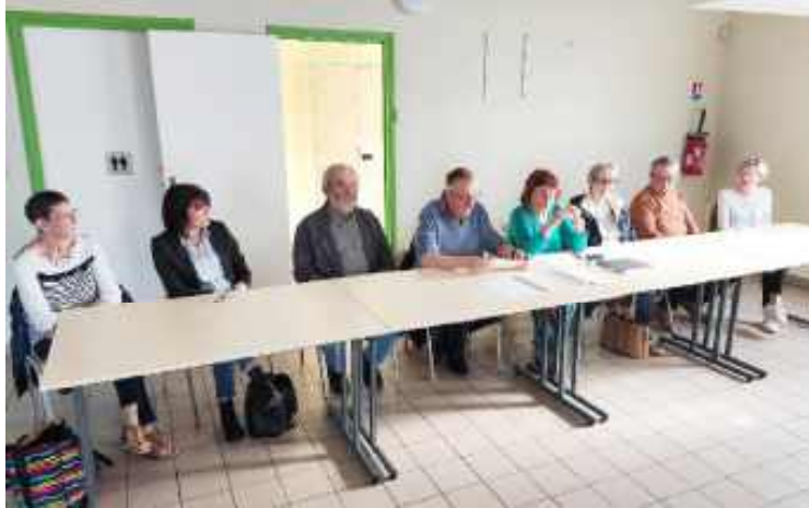
12 avril : Assemblée générale de la danse