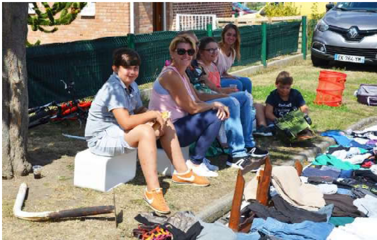
Un vide-grenier peut se faire en famille...