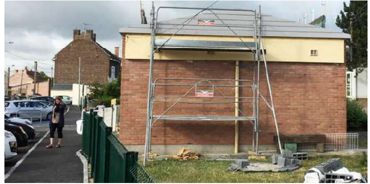
Travaux de toiture à l'école Jules-Verne.