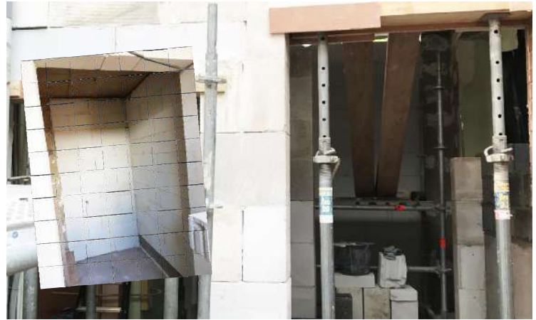
Les travaux de gros-oeuvre de l'ascenseur.