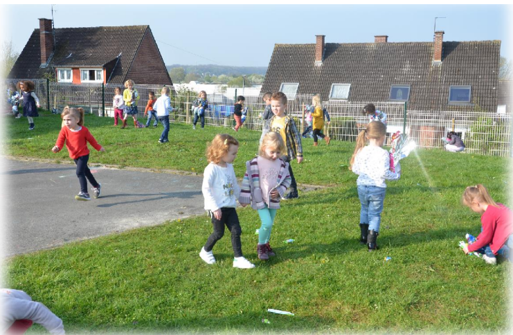
Chasse à l'œuf à l'école Hélène-Boucher.