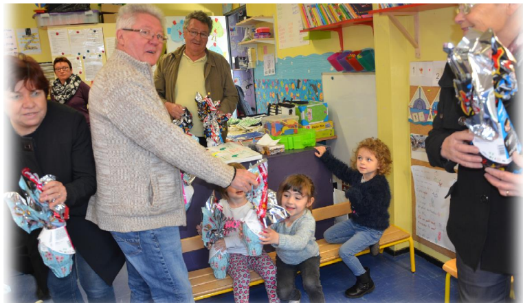
Distribution de friandises par les élus à l'école Gisèle-Hernu.