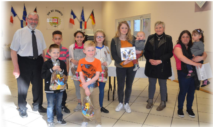
Les enfants du personnel communal ont aussi été gâtés.